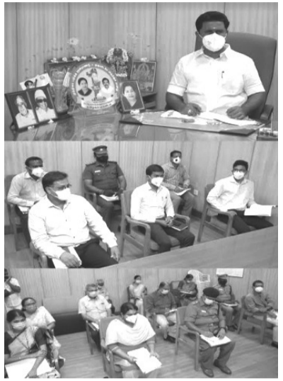
சிகிச்சை அளித்து குணமடைந்து வீடு திரும்பும் வரை தீவிரமாக கண்காணிக்க நடவடிக்கை எடுக்கவும், விழிப்புணர்வு கலைநிகழ்ச்சிகள் தொடர்ந்து நடத்தி பொதுமக்களிடம் கொரோனா தொற்று பரவாமல் தடுப்பது குறித்து விழிப்புணர்வு ஏற்படுத்த கேட்டுக்கொண்டார். கொரோனா நோய் கட்டுப்படுத்தப்பட பகுதிகளில்